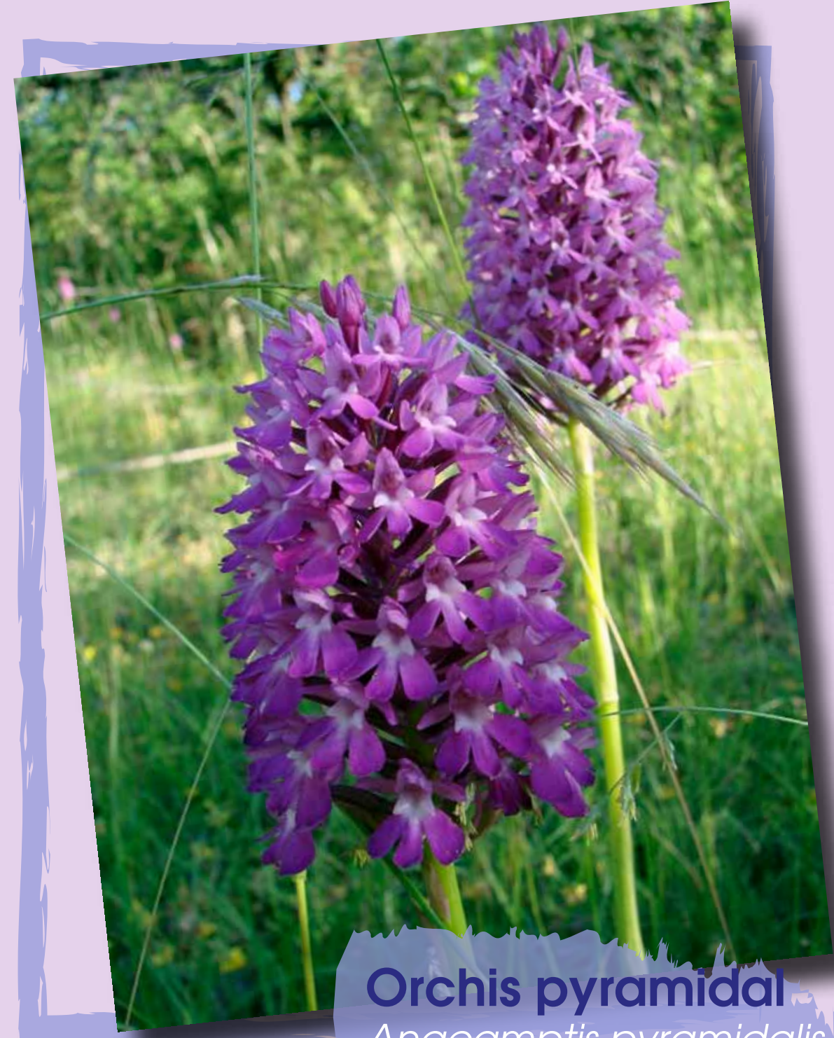
Orchis pyramidal Anacamptis pyramidalis