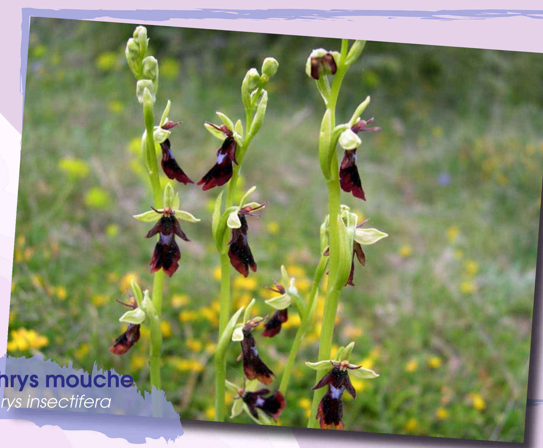
Ophrys mouche Ophrys insectifera