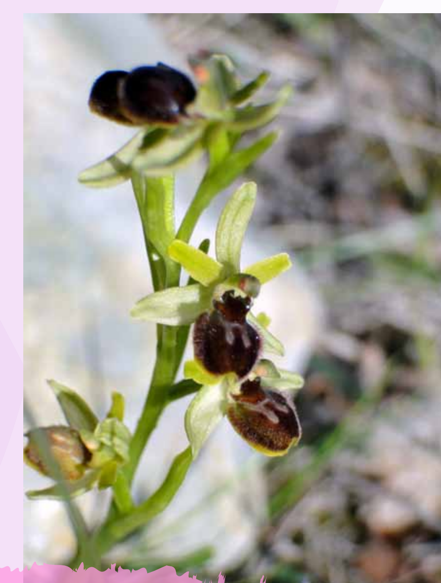
Ophrys petite araignée Ophrys araneola