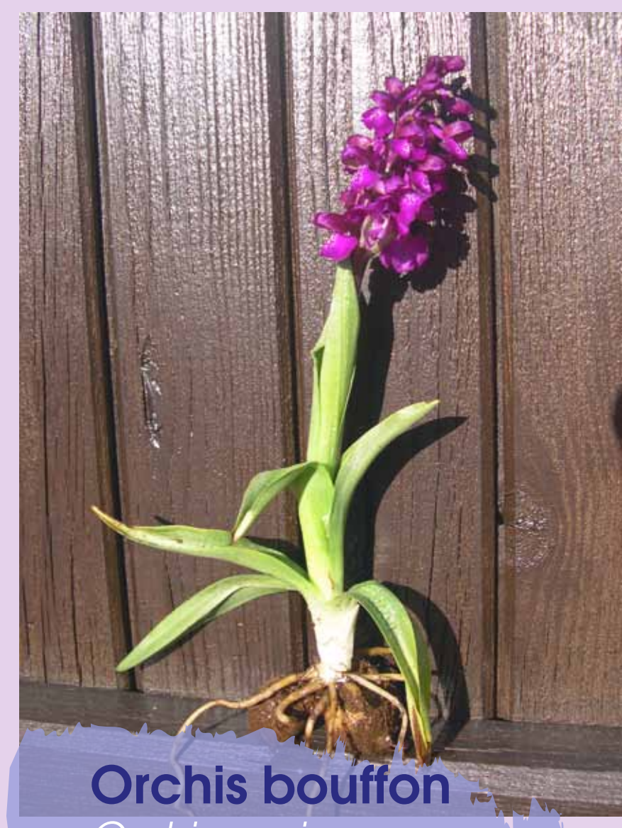
Orchis bouffon Orchis morio