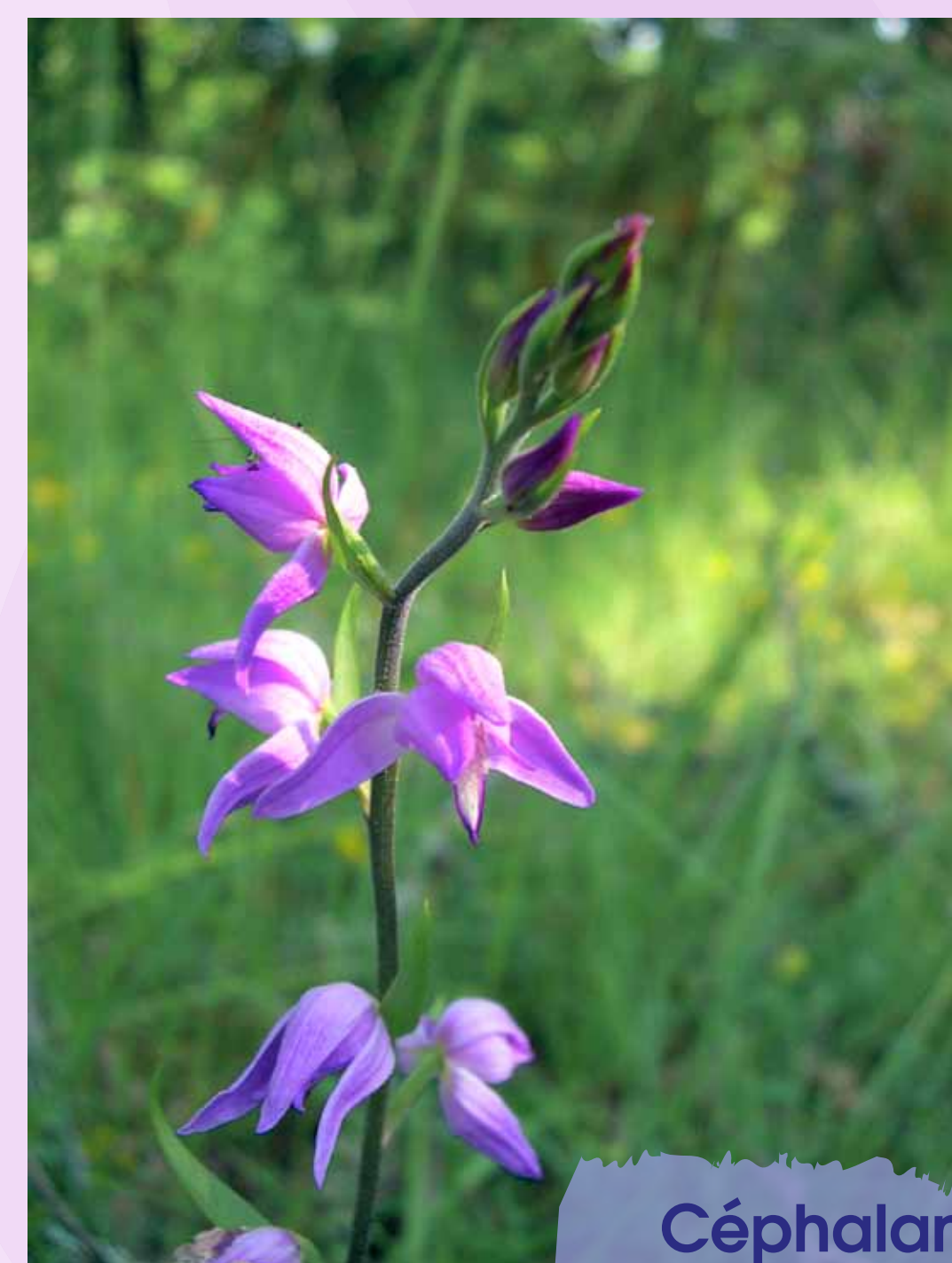
Céphalanthère rouge Cephalanthera rubra