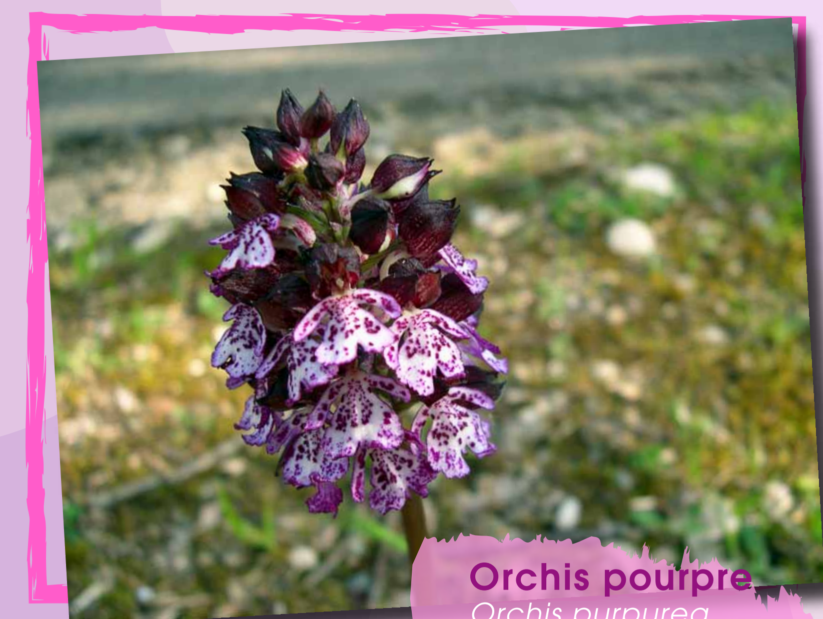
Orchis pourpre Orchis purpurea