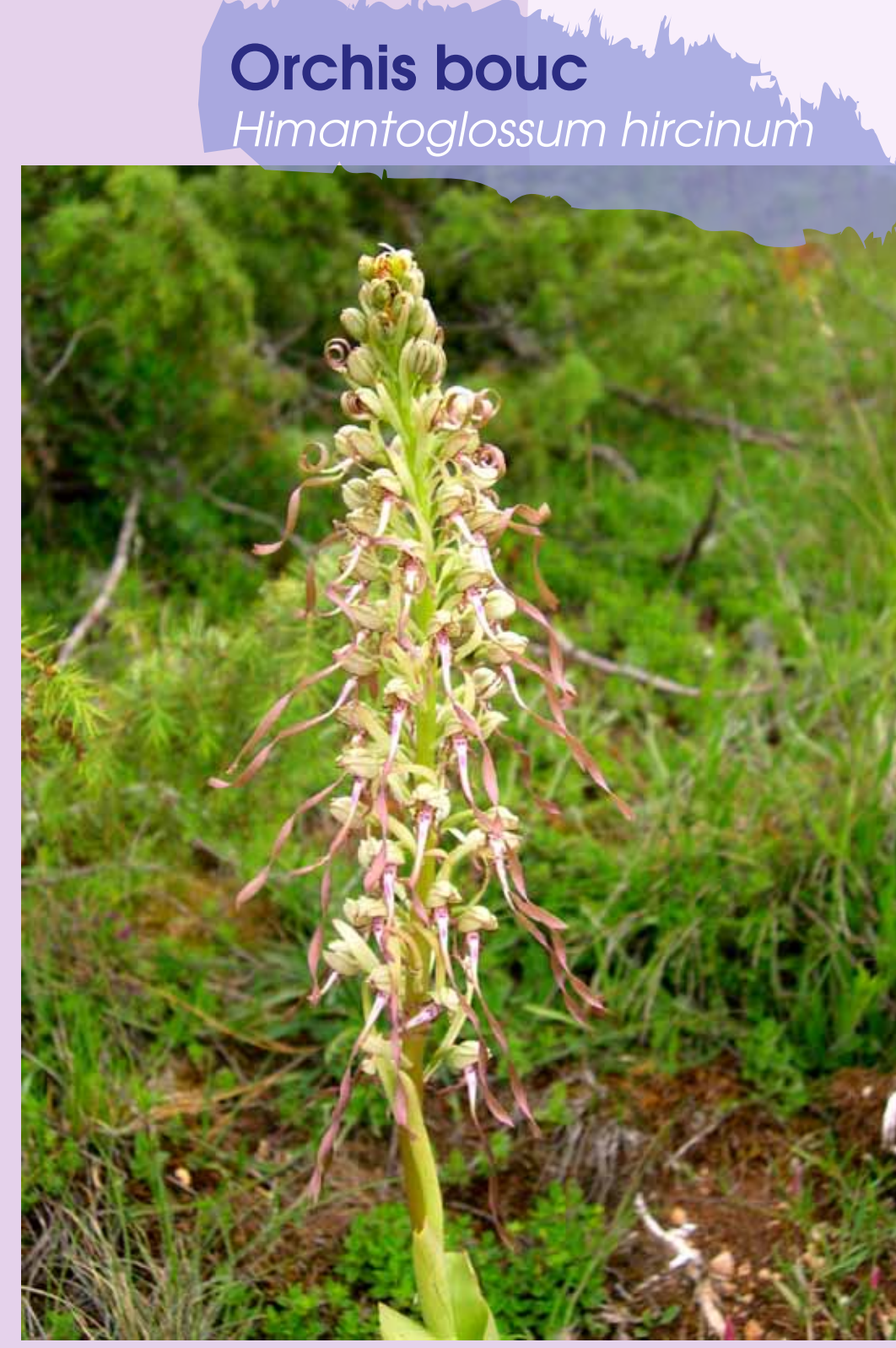
Orchis bouc Himantoglossum hircinum