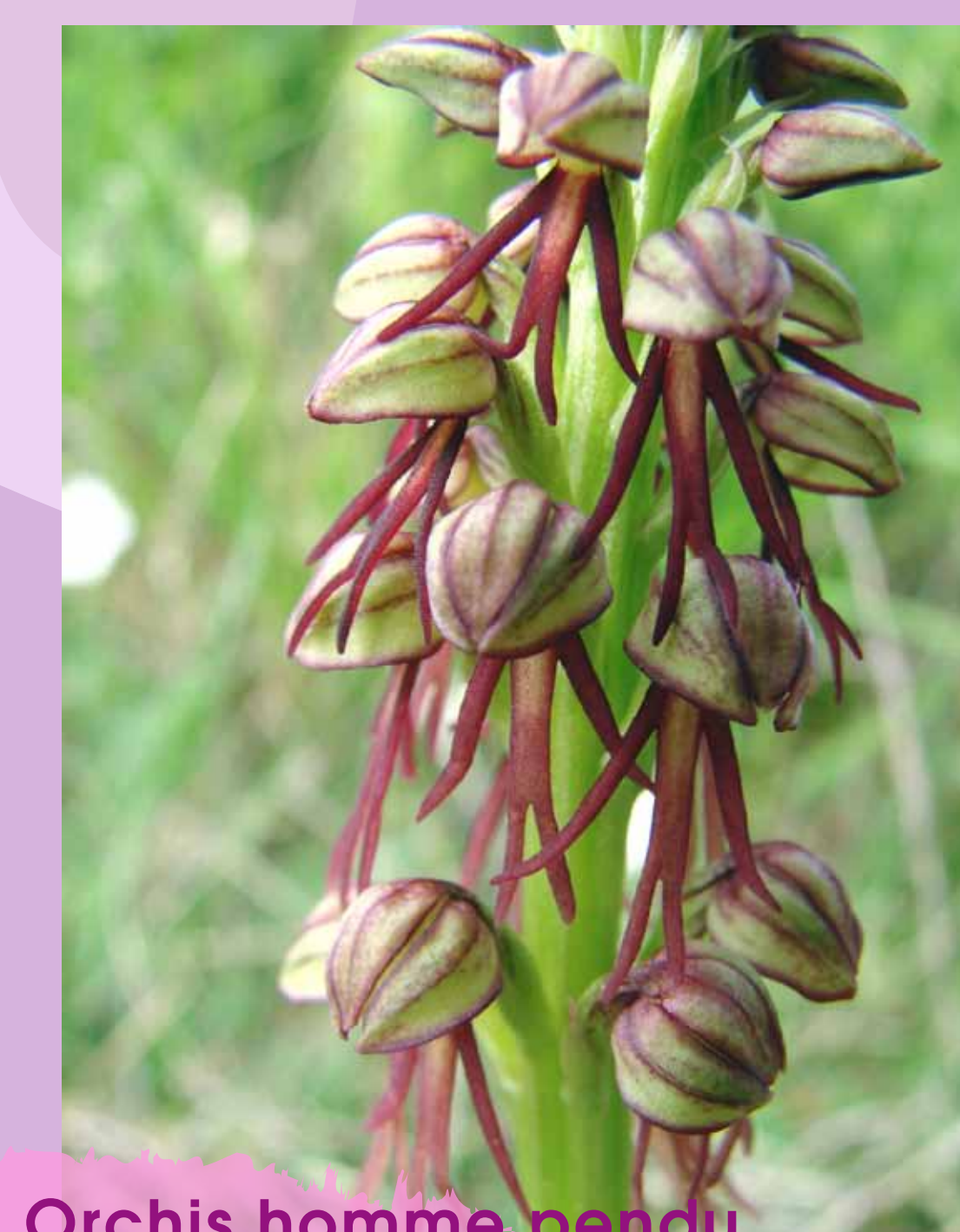
Orchis homme pendu Orchis anthropophora