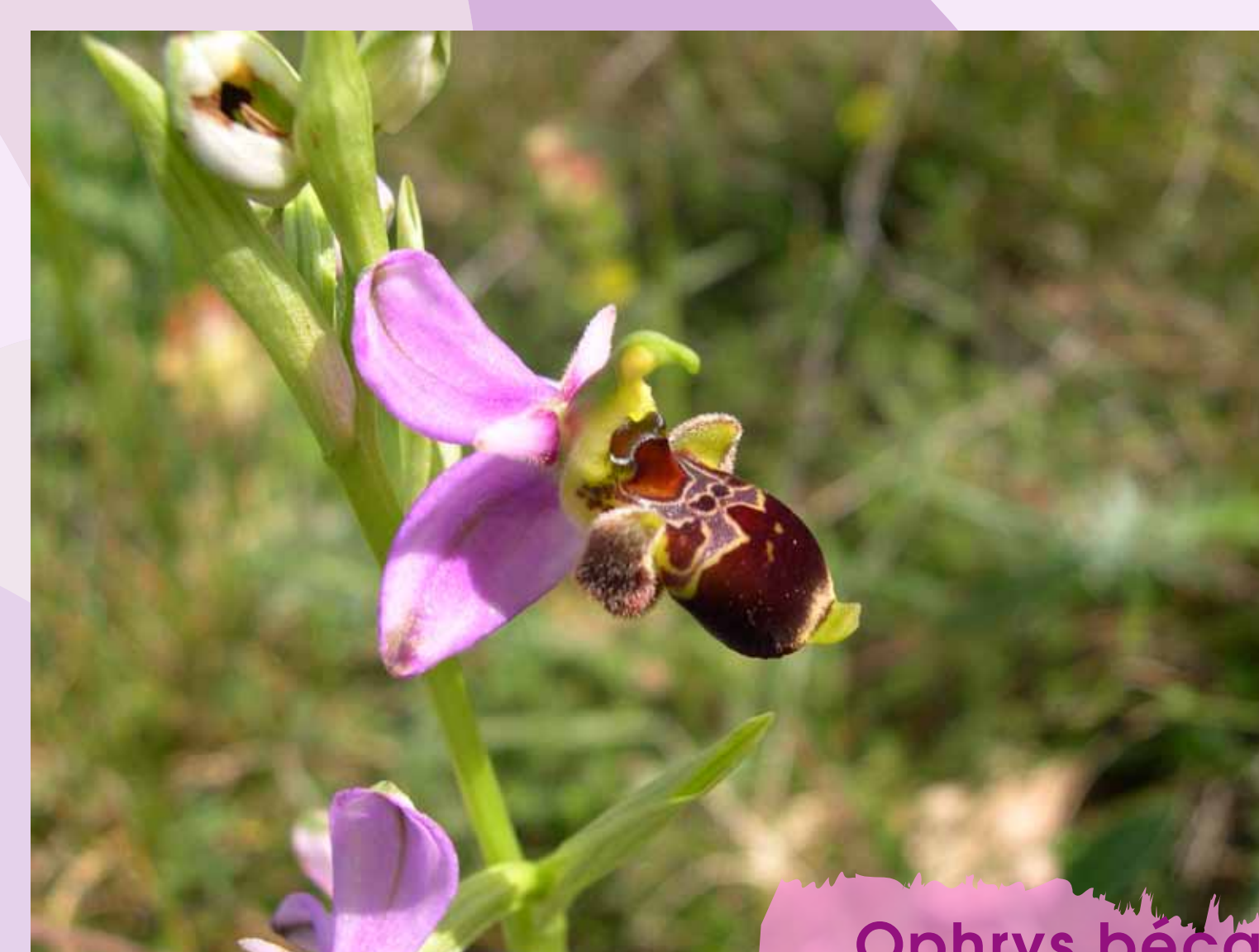
Ophrys bécasse Ophrys scolopax