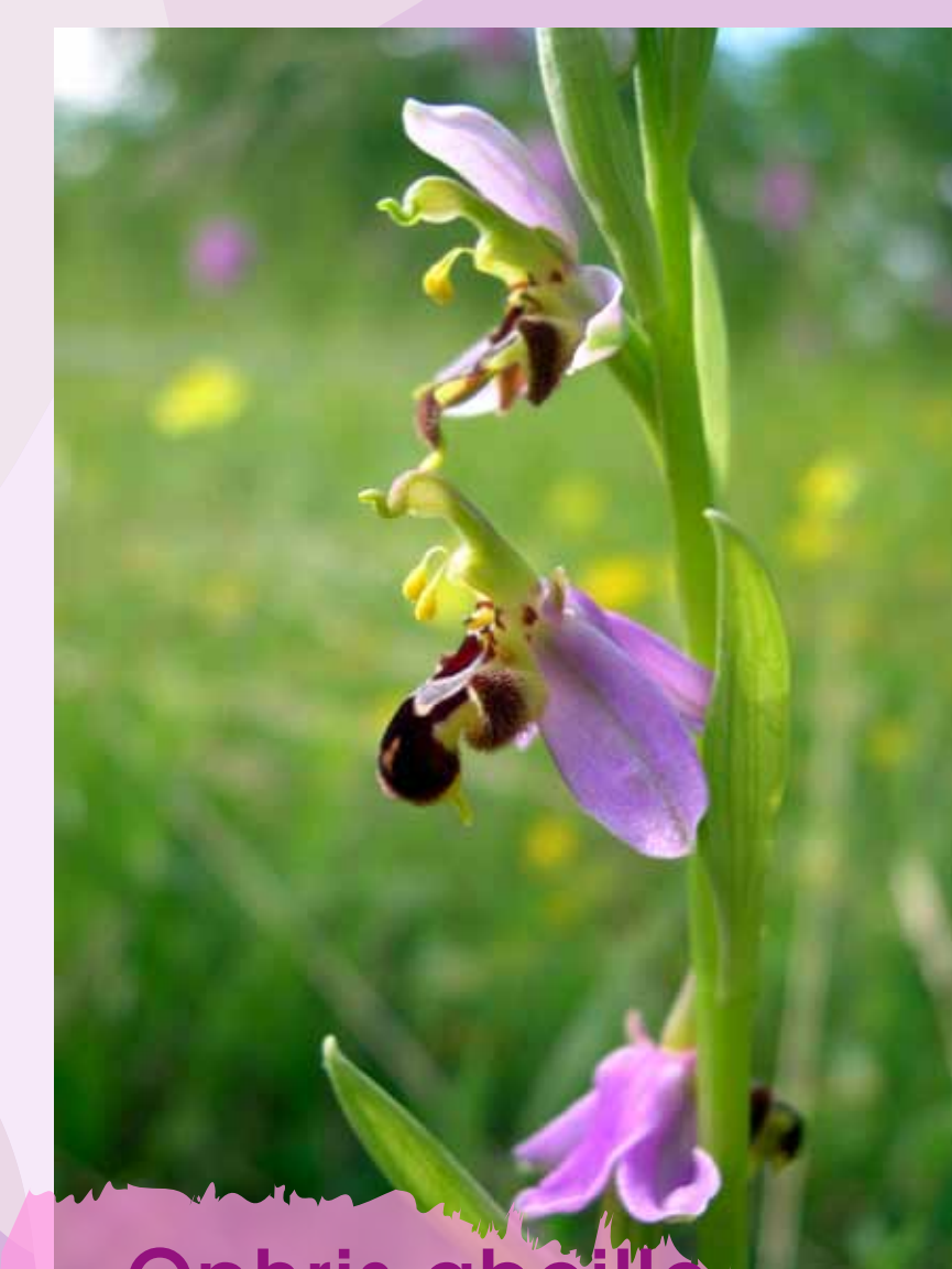
Ophrys abeille Ophrys apifera