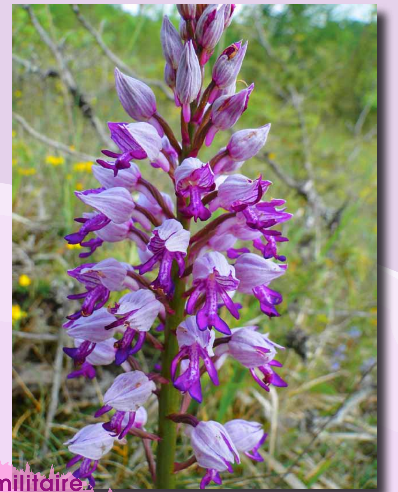
Orchis militaire Orchis militaris