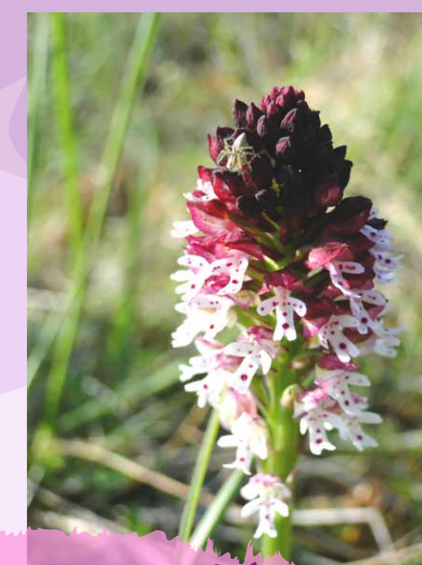
Orchis brûlé Neotinea ustulata