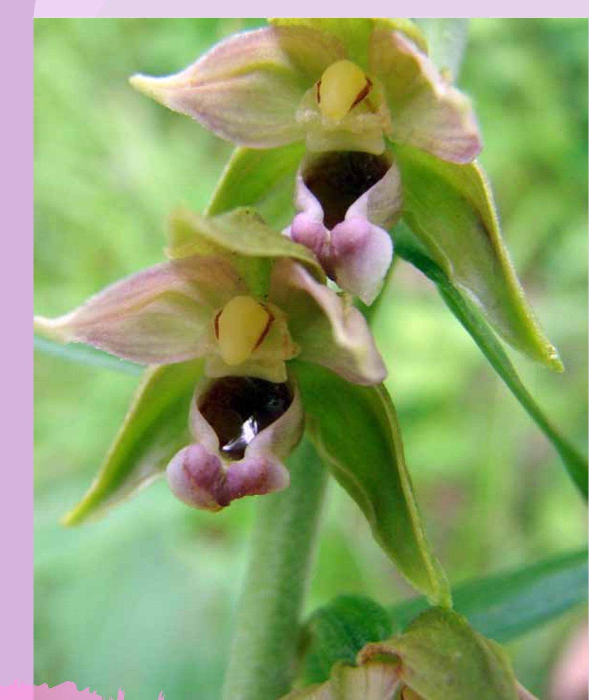
Epipactis helleborine Epipactis helleborine