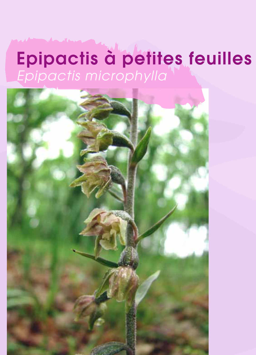
Epipactis à petites feuilles Epipactis microphylla