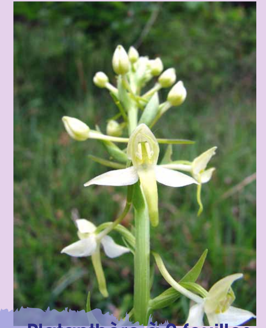
Platanthère à 2 feuilles Platanthera bifolia