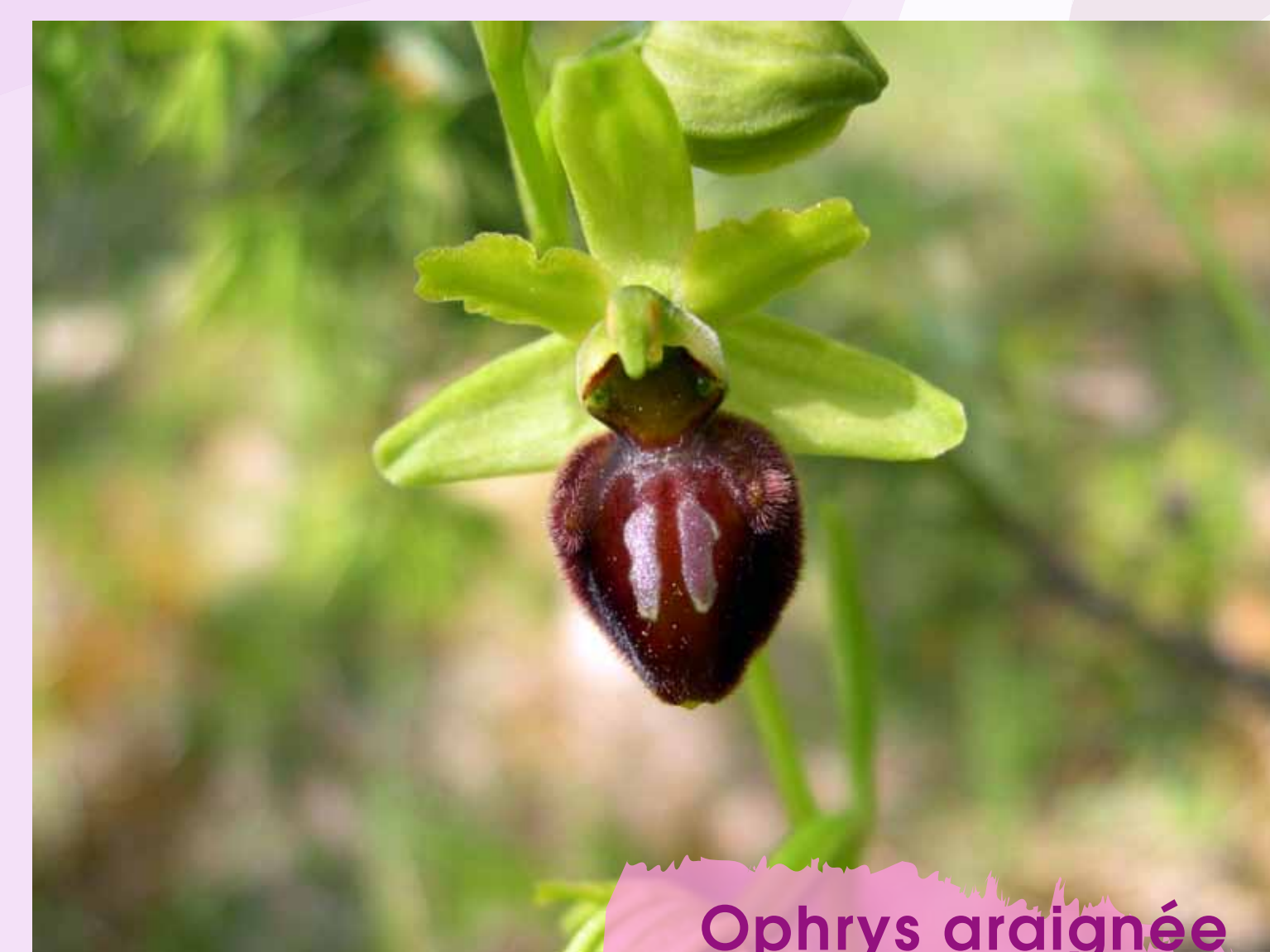
Ophrys araignée Ophrys aranifera