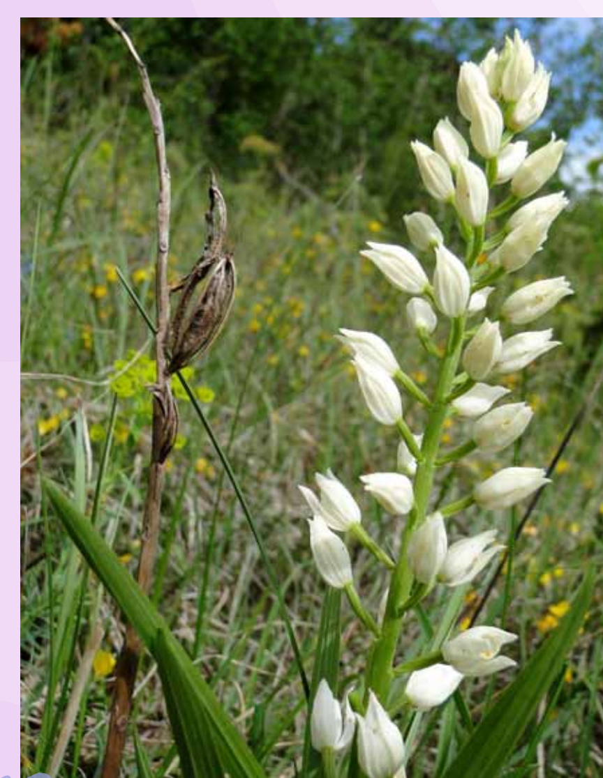
Céphalanthère à longues feuilles Platanthera bifolia