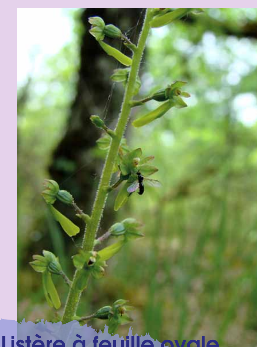
Listère à feuille ovale Platanthera bifolia