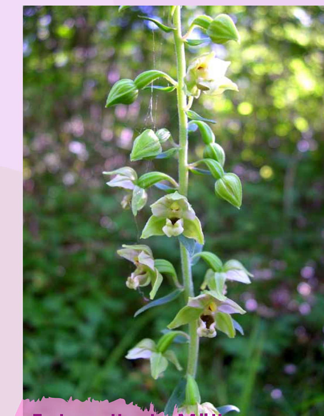
Epipactis de Müller Epipactis muelleri