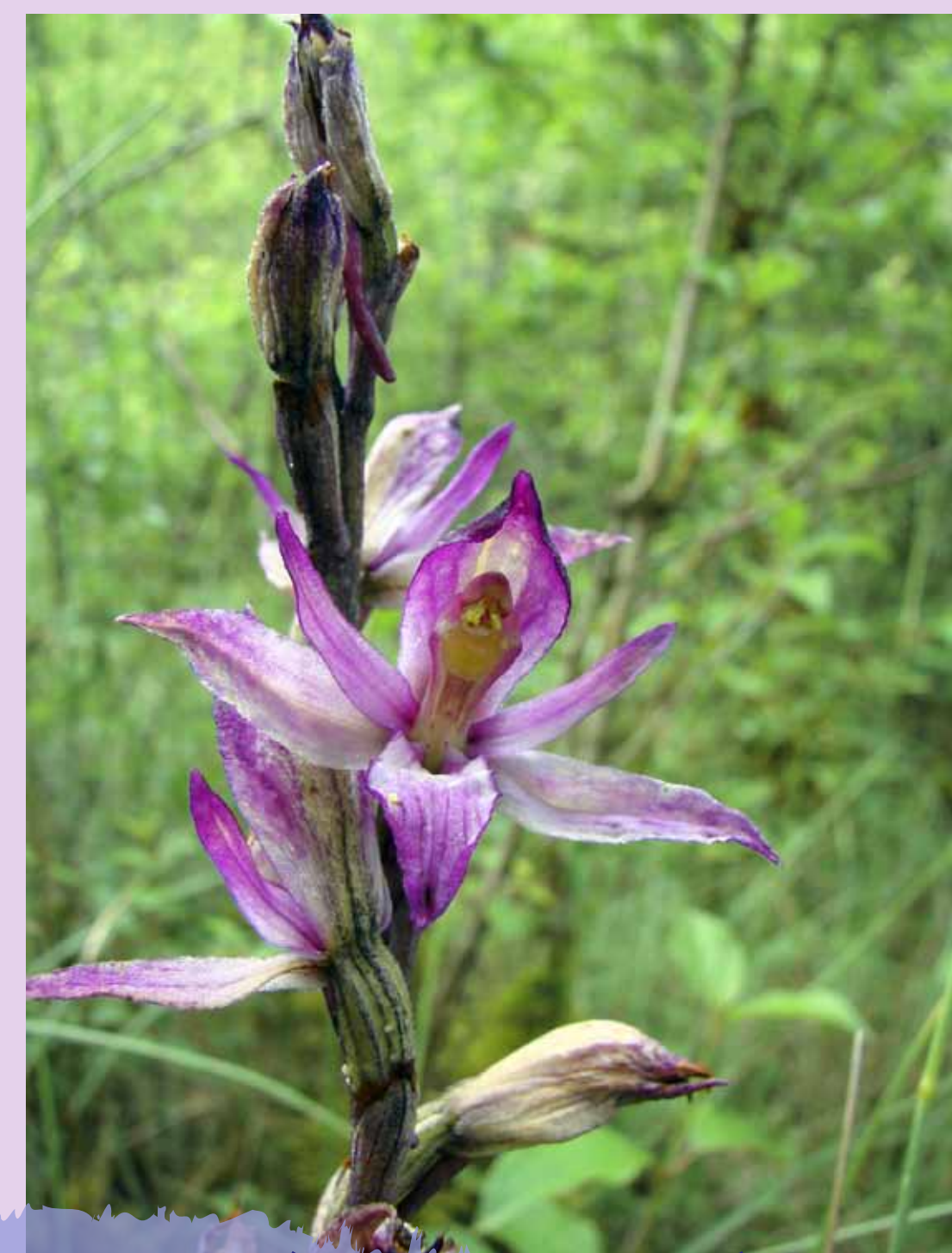
Limodore à feuilles avortées Limodorum abortivum