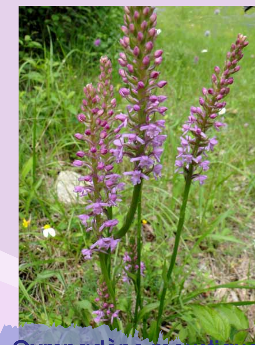
Gymnadène moussique Gymnadenia conopsea

Nous avons fait le choix de montrer les orchidées et d'expliquer leur mode de reproduction en espérant que de cette manière les visiteurs, après les avoir découvertes, auraient envie de les protéger quand ils les rencontreraient dans la nature. Merci de nous prouver que nous avons fait le bon choix !