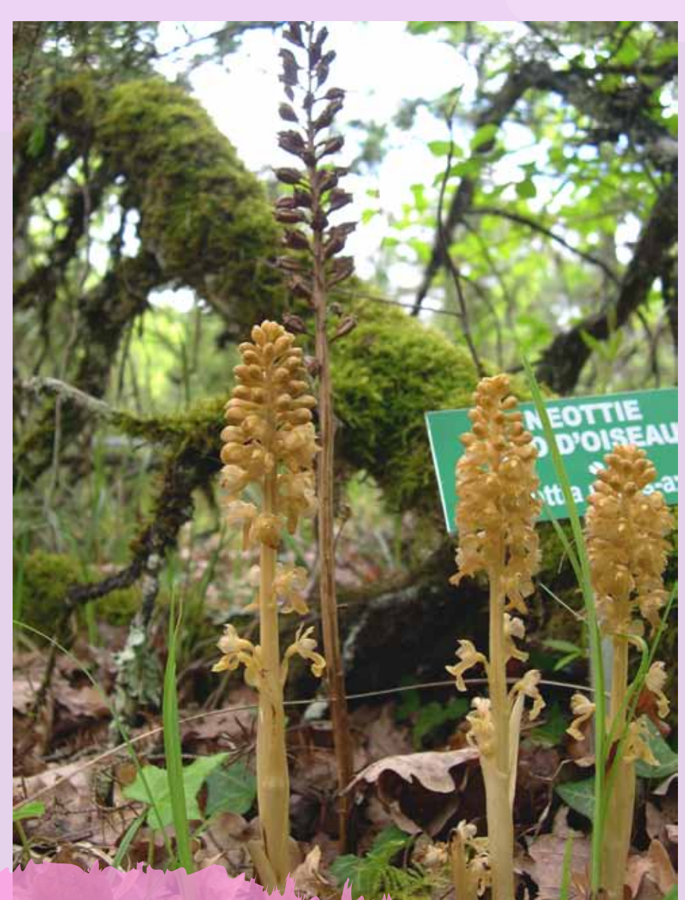
Néottie nid d'oiseau Neottia nidus avis